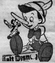
" PINOCHO "

Maravilla de Maravillas! — En multicolores y multiplanos! ALGO NUNCA VISTO!